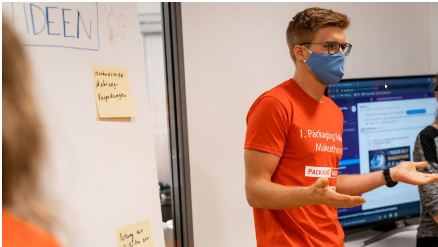
Am Anfang steht die gemeinsame Ideensammlung, bevor es an die Projektarbeit geht.